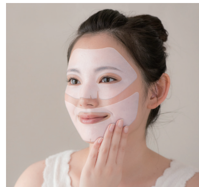
スキンケア用ゲル使用例

高湿潤で各種の薬効成分を内包した「テクノゲル CPグレード」は、フェイスマスクや冷却シートとして使用されていますが、「マスクの浮き」や「シートの剥がれ」が気になるというユーザーフィードバックもあり、肌との一体感に課題がありました。